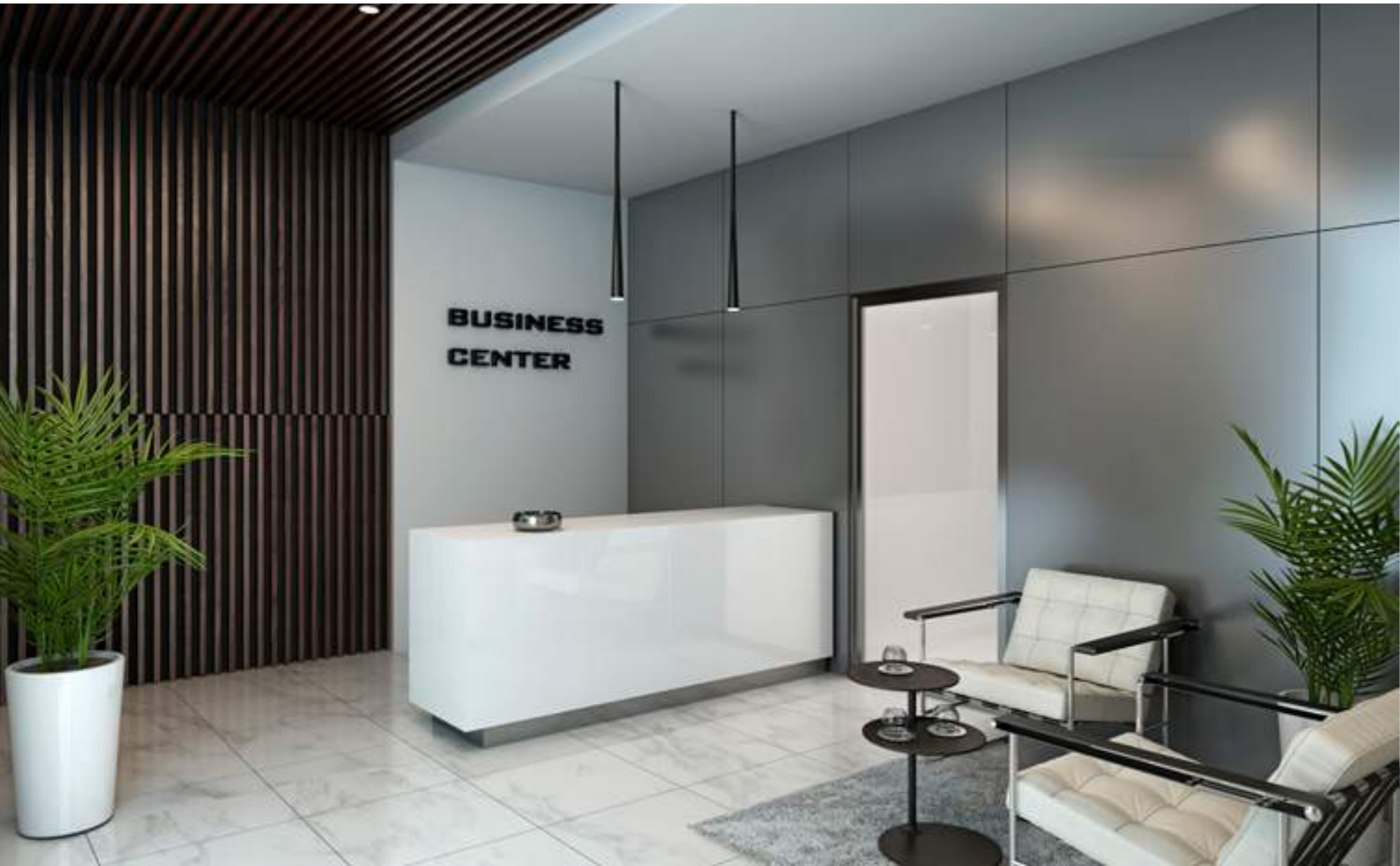
*Imágenes y medidas referenciales sujetas a cambios según diseño del proyecto. **Área aproximada de Business Center: 16.62 m 2