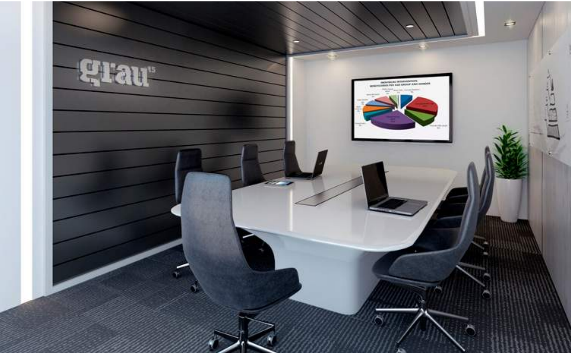
*Imágenes y medidas referenciales sujetas a cambios según diseño del proyecto. **Área aproximada de Directorios: 9.50 m 2