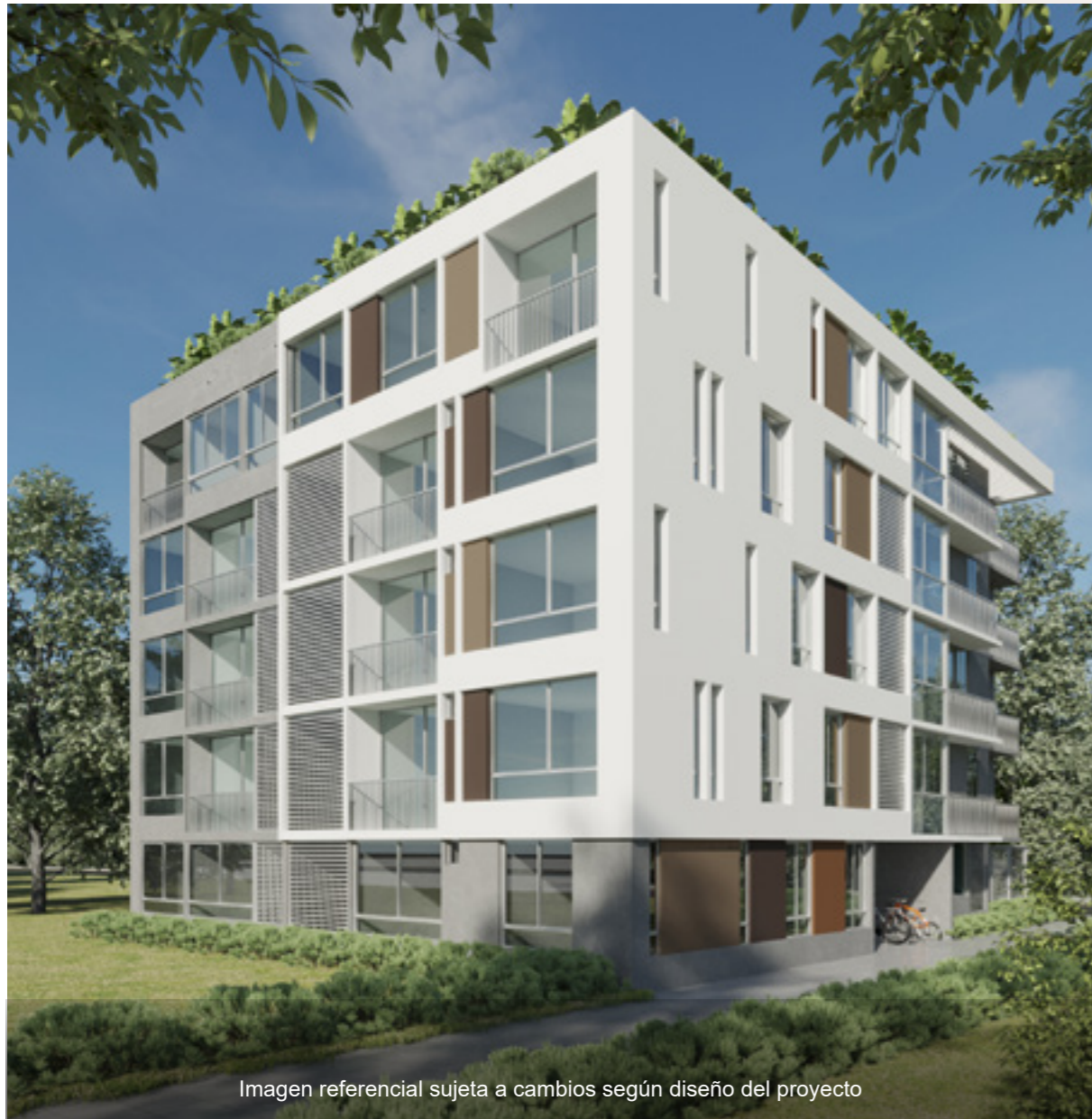
Imagen referencial sujeta a cambios según diseño del proyecto